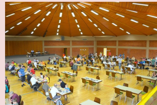
Impressionen von den Vellmarer Schachtagen 2012 am gleichen Ort.