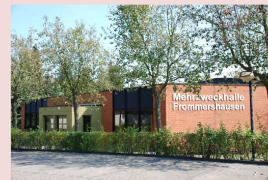
Der Veranstaltungsort in Vellmar-Frommershausen.

Preise werden nach Punkten und als Zweitwertung und Drittwertung nach Buchholz und Buchholzsumme, bei einem Streichresultat verteilt. Keine Doppelpreise. Preise werden nur an zur Siegerehrung persönlich anwesende Preisträger verteilt. Die Verteilung von Preisen an eventuelle Nachrücker erfolgt nach dem Ermessen der Turnierleitung.