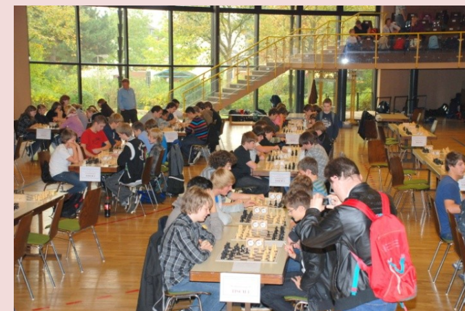
Impressionen vom Hessischen Schulschach Pokal 2010