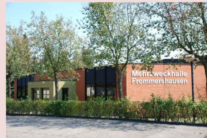
Der Veranstaltungsort in Vellmar-Frommershausen.

Preise werden nur an zur Siegerehrung persönlich anwesende Preisträger verteilt. Die Verteilung von Preisen an eventuelle Nachrücker erfolgt nach dem Ermessen der Turnierleitung.